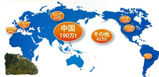
世界のタングステン埋蔵量

主要原料であるタングステンについては右図のように偏在しており、埋蔵されている国に限られているため、日本では全量を輸入に依存しており、常に供給リスクにさらされています。加えて、産出国からの輸出量が制限されているために、市場の相場を高騰させる原因にもなっています。また、世界のタングステン消費量も年々増加しており、今後の安定供給に懸念がもたれています。